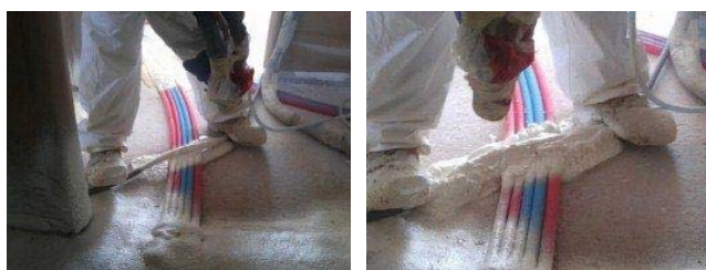
Projection sur les croisements de gaines

L'applicateur débute la projection sur les zones de croisements des canalisations. Pour remplir l'espace créé par leur chevauchement, le mouvement du bras de l'applicateur lors de la projection doit suivre le sens du conduit supérieur et doit être réalisé de chaque côté de celui-ci. Cette opération peut être répétée jusqu'à la suppression totale de tout vide dans ces zones après expansion de la mousse ( photos ci-dessous ).